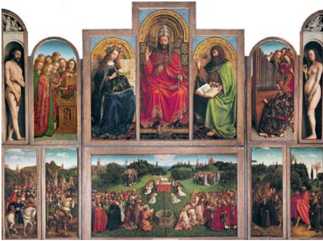
Genter Altar, Jan van Eyck, um 1432, St.-Bavo-Kathedrale, Gent