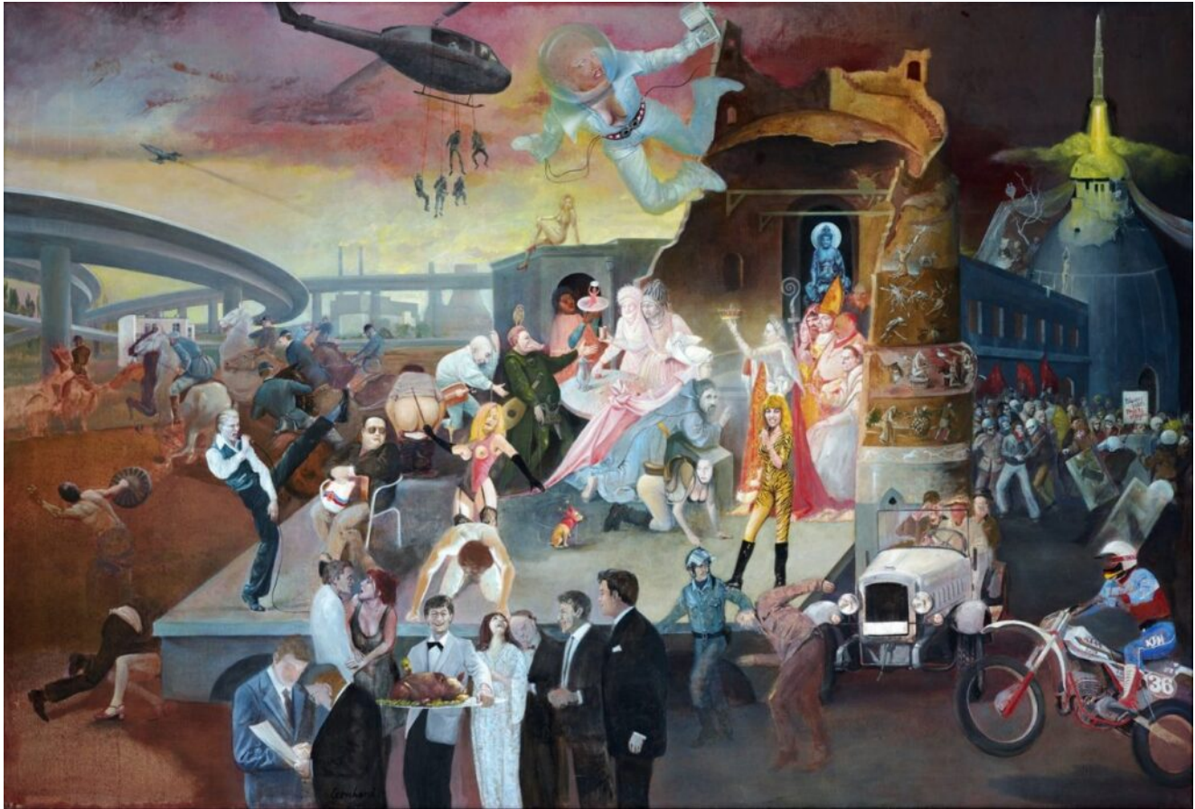
Hommage à Bosch